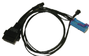
kabel SVG149 (panels NEC)