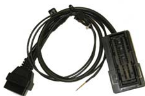
kabel SVG157 (panels MICRONAS)